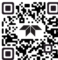
Applications FLIR de l'Apple Store